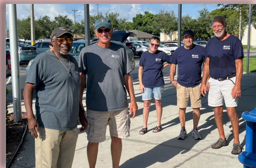
Friday Cape Coral MOW Crew!

Your warm, nutritious meals are delivered by caring and dedicated community volunteers. Our volunteer team drives nearly 900 miles every day to ensure that everyone receives a warm meal and a welcome smile. It takes 220 volunteers to deliver Meals on Wheels every week!